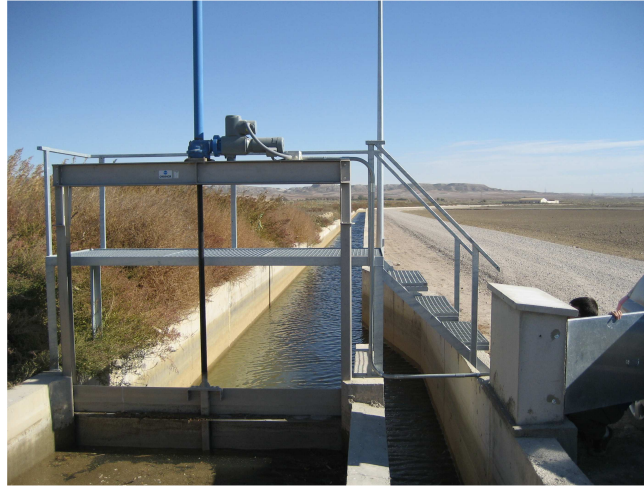
Figura 2. Automatización de compuertas