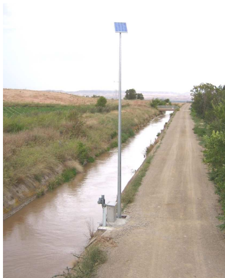
Figura 3. Alimentación solar para una instalación de automatización de compuerta sobre canal

Uno de los aspectos más importantes en este sentido para la automatización de compuertas y válvulas es la utilización de actuadores eléctricos que, con tensiones de trabajo de 12 o 24V y con consumos muy reducidos, son capaces de operar sobre compuertas de grandes dimensiones (fig 3).